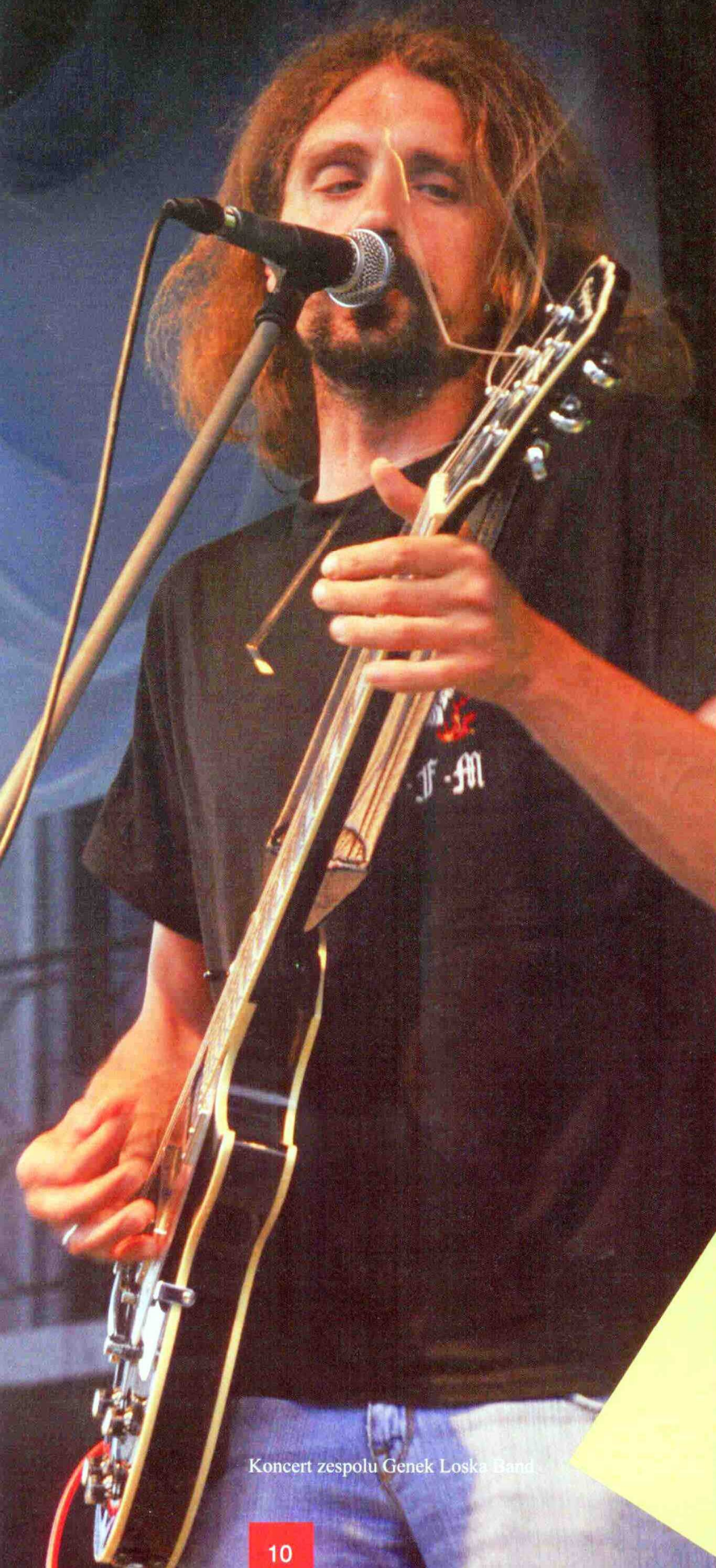
Koncert zespołu Genek Loska Band