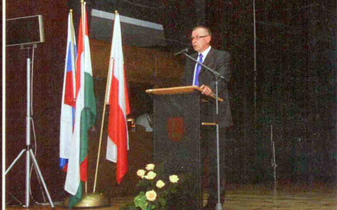
Konferencja w ramach programu „Europa dla Obywateli”